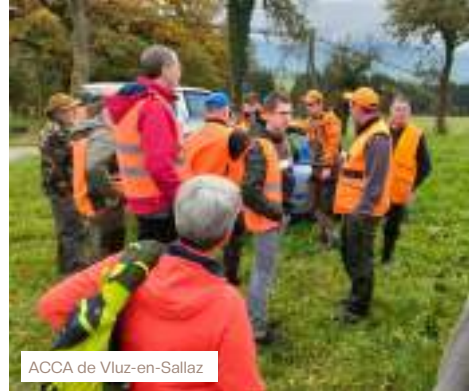
ACCA de Vluze-en-Sallaz