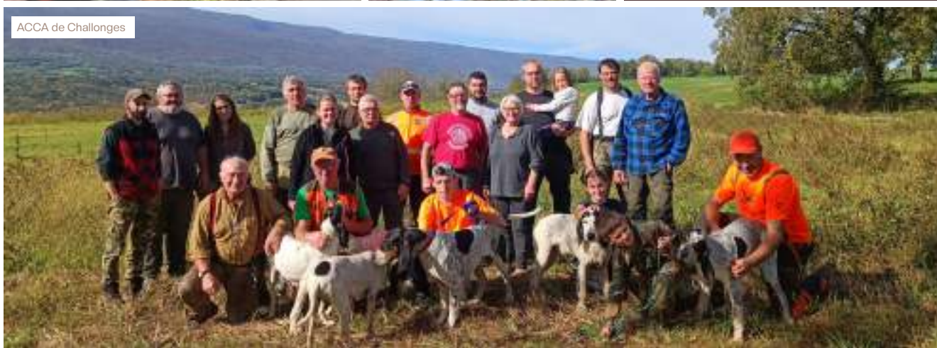
ACCA de Challonges

Allèves | Archamps | Bassy | Bonneville | Challonges | Chatillon sur Cluses | Clarafond Arcine | Cluses | Cranves-Sales | Cruseilles | Cusy | Diane Grande Gorge (Collonges) | Excenevex | Faverges | Fillinges | Juvigny | La Clusaz | Les Clefs | Les Ollières | Loisin | Marcellaz-Albanais | Marignier | Marin | Orcier | Sciez | Sevrier/Annecy | Seytroux | Viuz- en-Sallaz