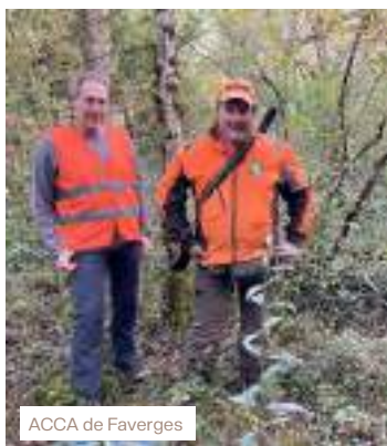
ACCA de Faverges

Merci aux sociétés de chasse qui se sont investies cette année et qui ont fait de cette journée une superbe vitrine de la chasse de la Haute-Savoie :