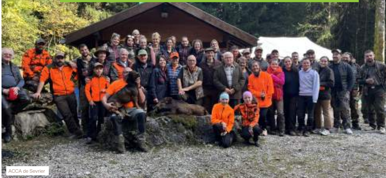
ACCA de Sevrier

Dimanche 20 octobre avait lieu la 9 ème édition du dimanche à la chasse en Haute-Savoie. Véritable rendez-vous entre chasseurs et non-chasseurs cette année encore, 28 sociétés de chasse ont répondu présentes, prêtes à offrir à près de 200 participants une expérience unique. Le temps d'une matinée, ces visiteurs, qu'ils soient néophytes ou simplement curieux, ont découvert l'essence même et les valeurs de la chasse communale.