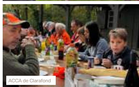
ACCA de Clarafond