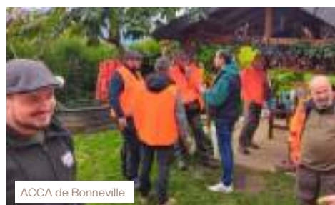
ACCA de Bonneville