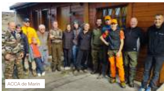
ACCA de Marin