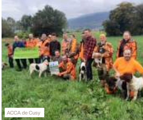
ACCA de Cusy