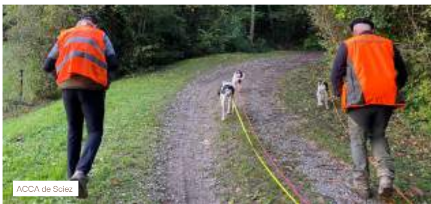
ACCA de Sciez

À Faverges, entre les Bauges et la Tournette, comme dans les 27 autres villages de Haute-Savoie, le message était clair : la chasse est une affaire d'instincts et de confrontation avec le sauvage mais aussi de transmission, de valeurs à partager et de respect mutuel . La convivialité est l'une de ces valeurs et la journée s'est achevée autour d'une table généreuse, où les histoires ont fusé, les regards se sont croisés et