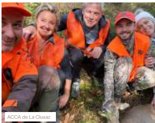
ACCA de La Clusaz