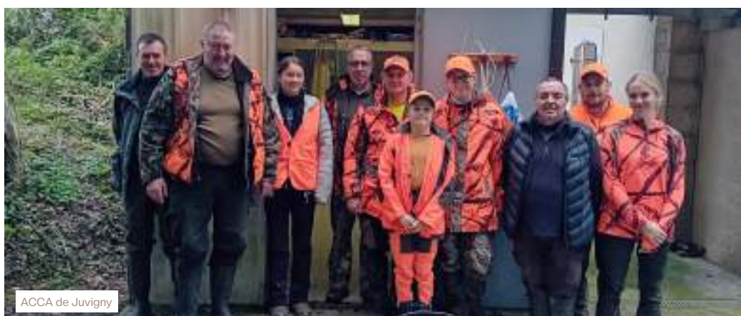
ACCA de Juvigny