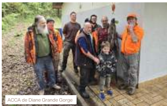
ACCA de Diane Grande Gorge