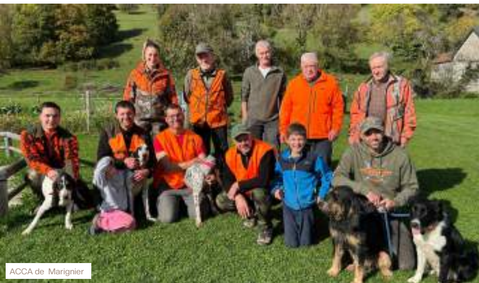
ACCA de Marignier