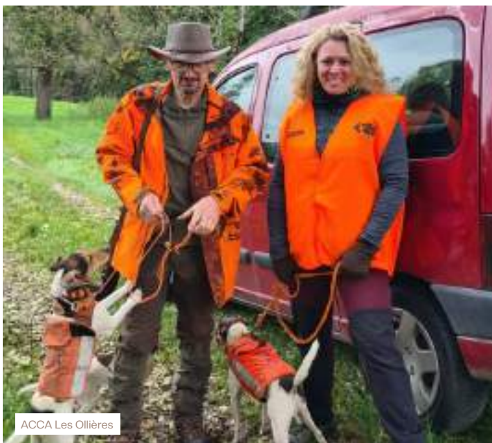
ACCA Les Ollières