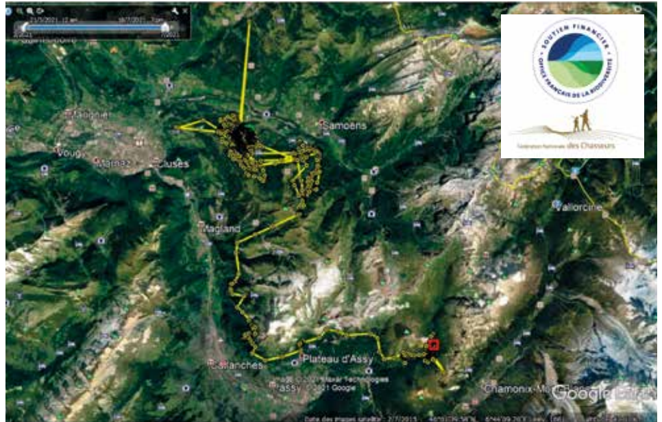
3/ Mâle Morillon Les Maissonnettes – collier n°14 – capture 5 le 20 mars 2021 (1 point aberrant)