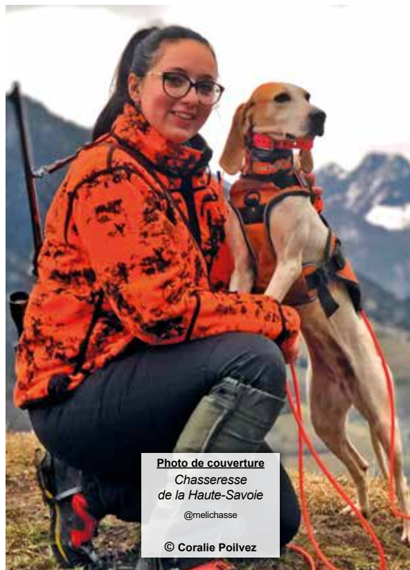
Photo de couverture